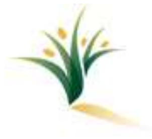
Table régionale de concertation des aînés de l'Estrie 300, rue du Conseil bureau 311 Sherbrooke, Québec J1G 1J4