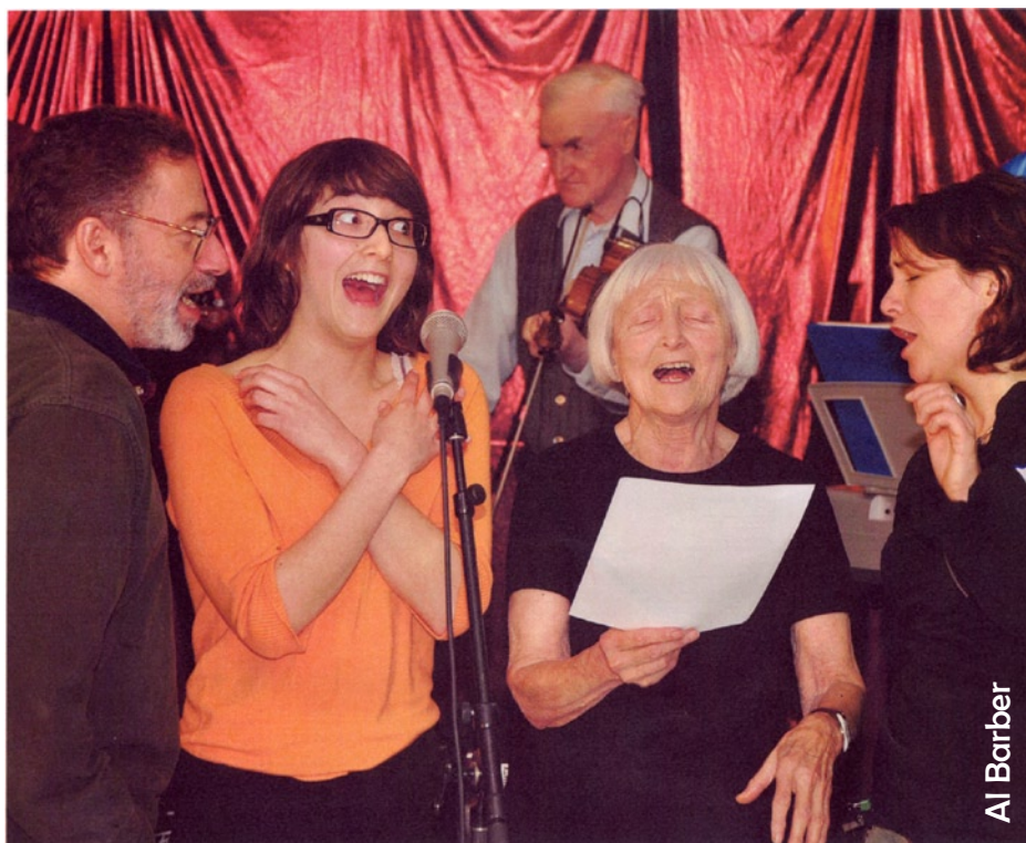
The 2nd Intergenerational Music Festival that was held last November 14 th and 15 th in Lennoxville was a huge success. This event brought together music lovers of all ages.

Join us for season's greetings, lots of information and light refreshments. Come to 257 Queen St. in Sherbrooke (Lennoxville). The parking lot behind the building is accessible via Charlotte Street. For more information, please call 819-566-5717 (1-866-566-5717).